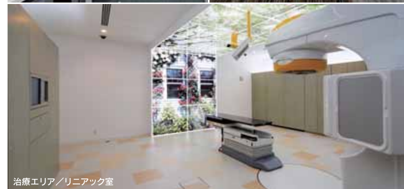
治療エリア / リニアック室