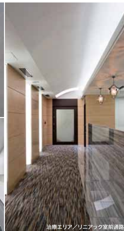
治療エリア / リニアック室前通路