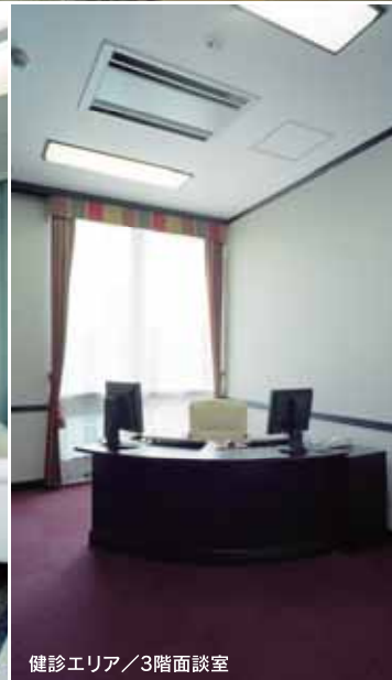
健診エリア / 3階面談室

広島市平和記念公園の西、平和大通りに面して立地するがん健診・がん治療の専門クリニックです。