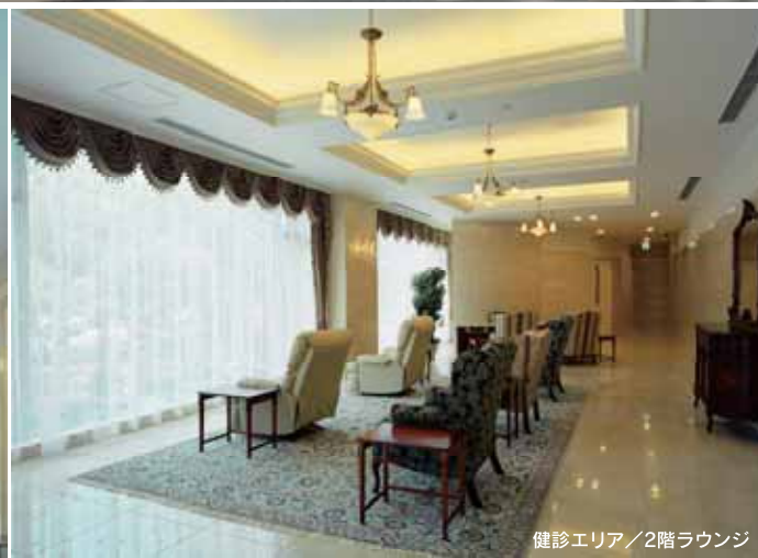
健診エリア / 2階ラウンジ