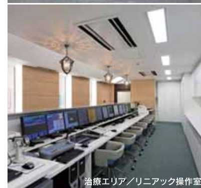
治療エリア / リニアック操作室