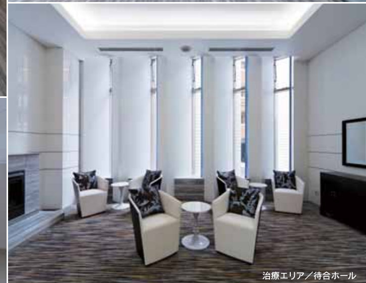
治療エリア / 待合ホール