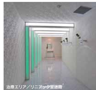
治療エリア / リニアック室迷路

また、一般的にリニアック治療室は治療機械だけの閉鎖的空間になりがちです。本クリニックでは、迷路部分に色の変化するLEDの照明ゲートや、治療室内にパティオをイメージした壁から天井にかけての間接照明を設置する事で、患者様に元気な気持ちを持って頂く手助けとなる様、明るいイメージを表現しました。