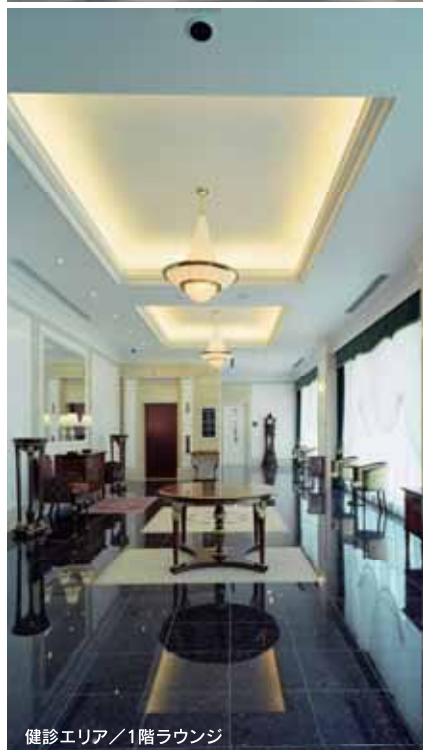
健診エリア / 1階ラウンジ