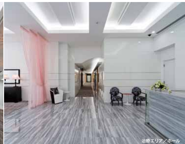
治療エリア / ホール