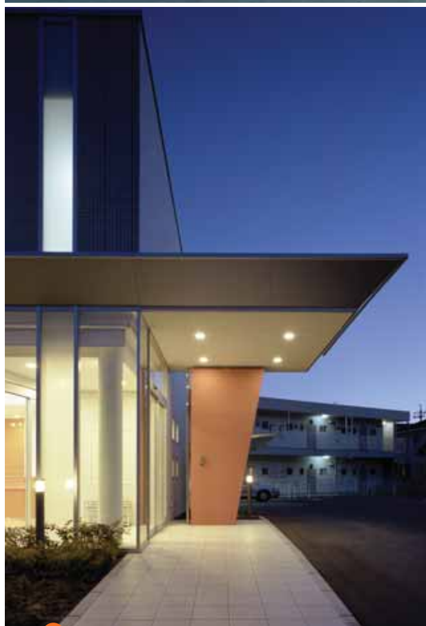
② スタイリッシュなデザインで誘導性の高い玄関。