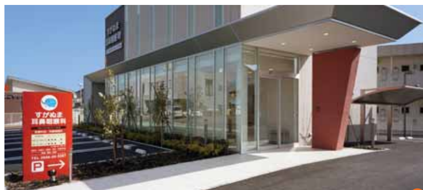
⑤ 彩度の高い色を用いたサインや出入口。