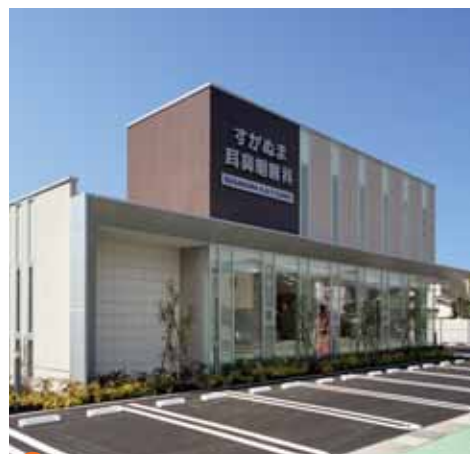
③ 変化のあるガラスのファサード。

色彩計画については暖色系を中心とした配色とし、穏やかで優しいイメージを創りました。その中で、サインや出入口に彩度の高い色を取り入れる事で、動線の明確化と共に、建物にリズム感+存在感を与えました。