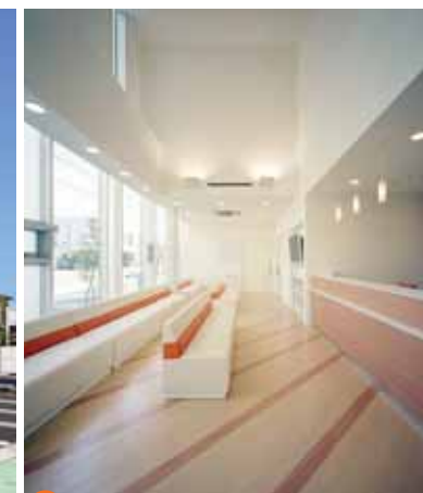
④ 暖色系を中心とした穏やかなイメージの待合室。