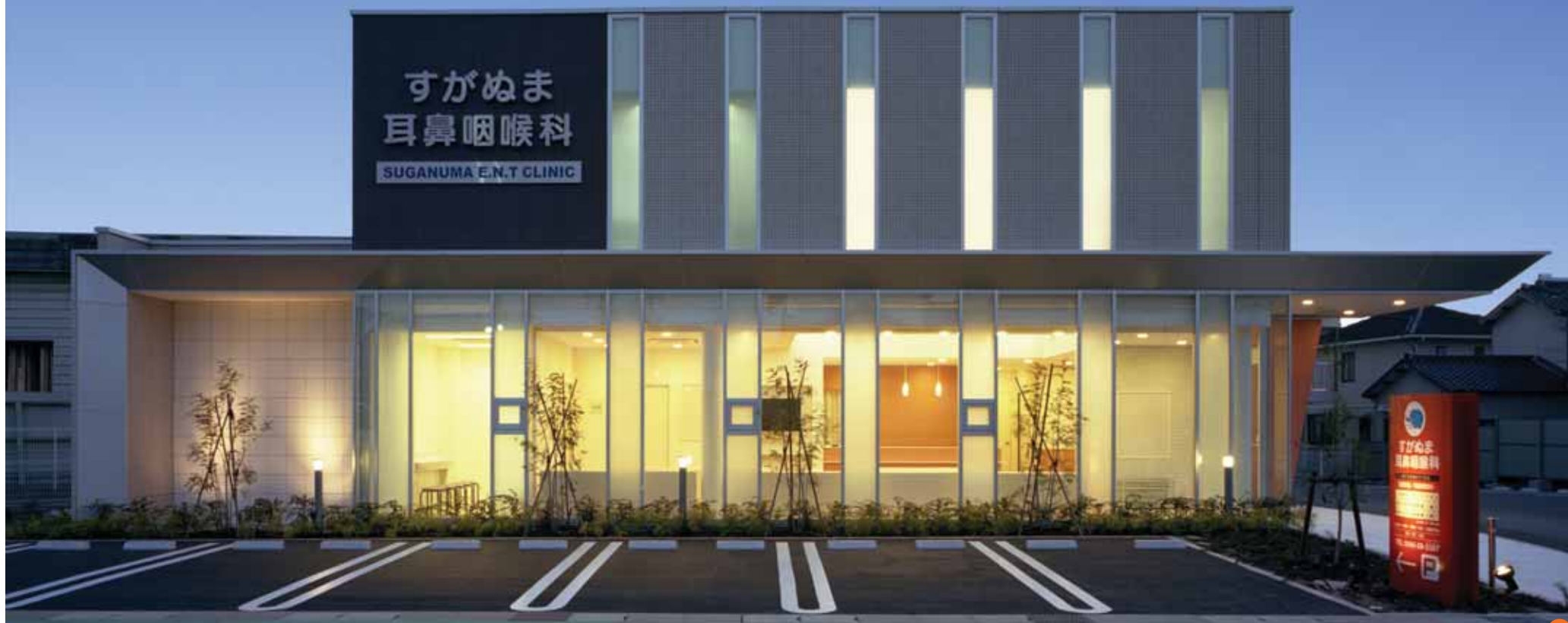
2頭身の建物バランス——透明感のある1階と、ボリューム感のある2階。①

所在地：愛知県刈谷市野田町馬池1-1、沖ノ道34-2 主要用途：診療所(耳鼻咽喉科)