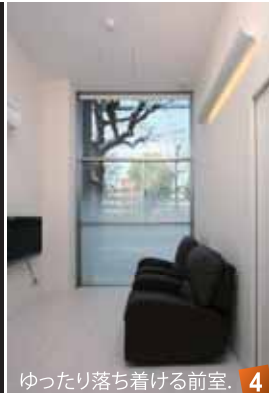
ゆったり落ち着ける前室。 4

内部は、外観のイメージを連続させ、ホワイト+ブラウンのカラーを用い上品で落ち着いた空間をつくっています。