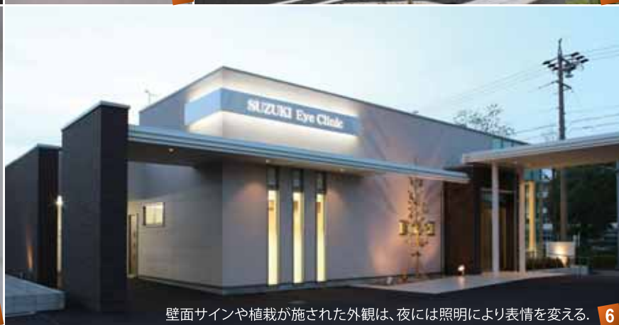
壁面サインや植栽が施された外観は、夜には照明により表情を変える。 6