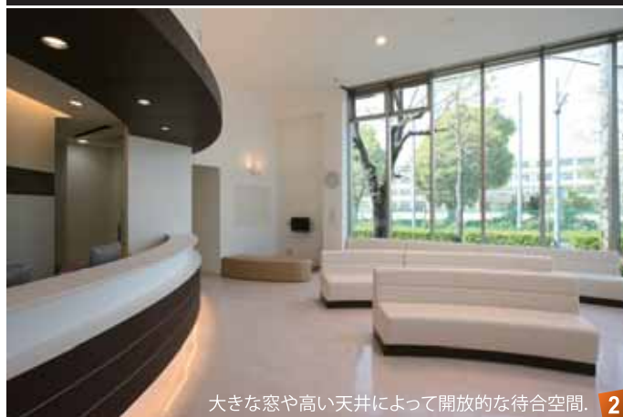
大きな窓や高い天井によって開放的な待合空間。 2