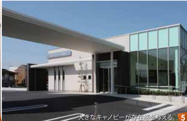
大きなキャンピが存在感を与える。 5