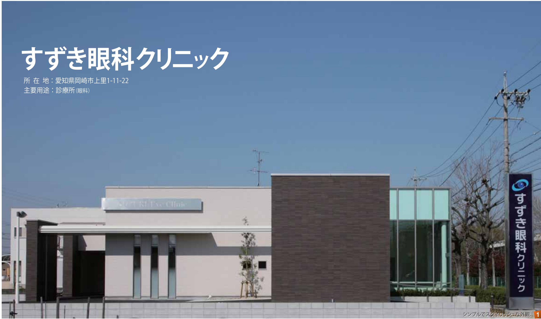
シンプルでスタイリッシュな外観。 1