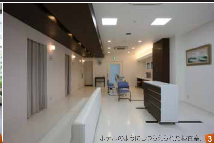
ホテルのようにしつらえられた検査室。 3